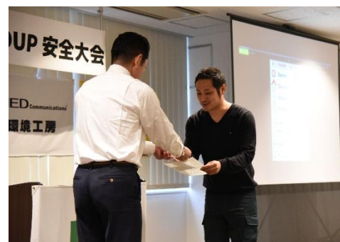
安全大会で行われた表彰の様子

さらに当社では、喫煙者0の取り組みを社員だけでなく、当社と関わるパートナー企業へも広げ建設業界全体のイメージアップにつなげるための活動に力を入れています。毎年2回行われる安全大会では喫煙者0の取り組みに力を入れているパートナー企業の表彰などを通して、喫煙者0の取り組みへの理解を深める活動も行っています。